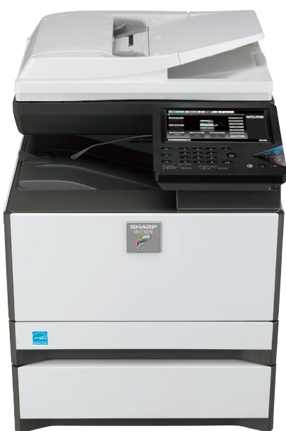
Koneessa valinnainen lisäpaperikasetti.